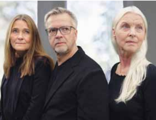
Krupka Trio