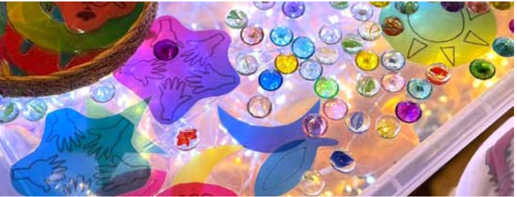
Blick in die Lichterkiste