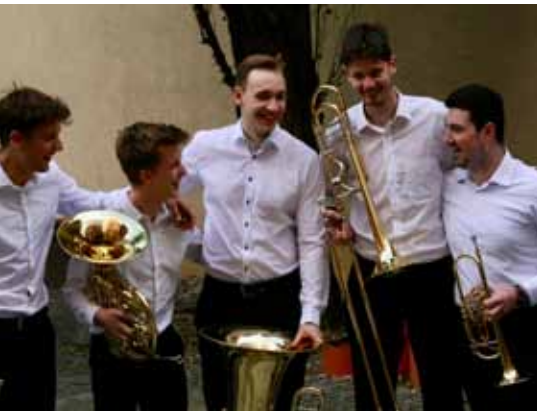
Berliner Luftblech