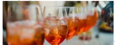
Federica Ariemma © unsplash.com

Wir freuen uns, mit Ihnen und Euch den Sommer, den Feierabend und die Übergänge zu feiern!